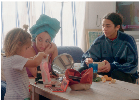
Fille de Lili Cazals - Projection et discussion - Soirée Marseilles ! Jeudi 20 mars à 20h30 au cinéma La Baleine.

Le Festival Tous Courts, festival international de court métrage à Aix-en-Provence, fêtera sa 43 e édition en décembre 2025. Ouvert au plus grand nombre, très investi auprès du public jeune, il assure chaque année, la promotion du court métrage et participe à l'émergence des talents de demain, avec près de 200 films diffusés dont plus de 70 en compétition.