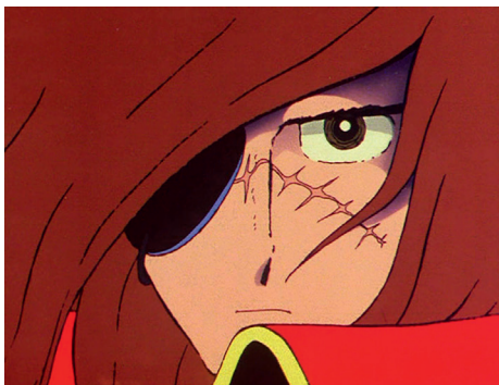
Captain Harlock (Albator) de Rintaro - Projection Génération animés japonais Mercredi 19 mars au cinéma Le Renoir à Aix-en-Provence.

3 titres pour découvrir ou redécouvrir à n'importe quel âge les premiers épisodes des dessins animés japonais mythiques des années 70. Une véritable machine à remonter le temps !